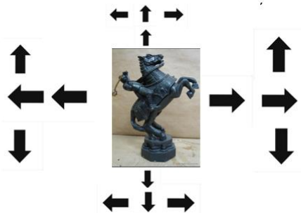
Anexo 14. Figura de Ajedrez Alfil Blanco Paris

Caballo Negro Odiseo Mata a Dolón Se mueven mediante movimientos con dos casillas y una girando hacia otra dirección, forma de "L"