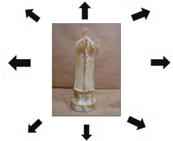
Anexo 17. Figura de Ajedrez Reina Negra Aquiles

Reina Blanca Héctor Mata al personaje de Patroclo Puede moverse como todas las figuras, excepto el movimiento del caballo