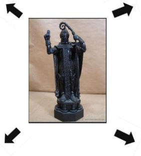
Anexo 16. Figura de Ajedrez Reina Blanca Héctor

Alfil Negro Diómedes Mata a Pándaro Se mueve de manera lineal en su color