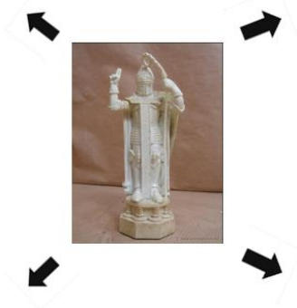
Anexo 15. Figura de Ajedrez Alfil Negro Diómedes

Alfil Blanco Paris Mata a Aquiles Se mueve de manera lineal en su color