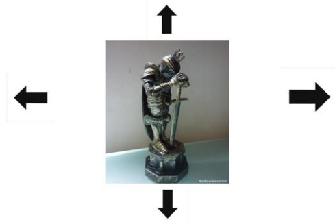
Anexo 20. Piezas de ajedrez originales peones negros

Rey Negro Neoptólemo Mata a Príamo Movimientos: una casilla en cada dirección