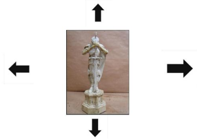
Anexo 19. Figura de Ajedrez Rey Negro Neoptólemo

Rey Blanco Príamo Muere a manos de Neoptólemo Movimientos: una casilla en cada dirección