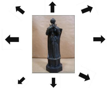
Anexo 18. Figura de Ajedrez Rey Blanco Príamo

Reina Negra Aquiles Mata a Héctor y a Memnón Puede moverse como todas las figuras, excepto el movimiento del caballo